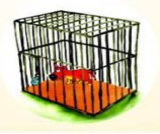
Ikulong at obserbahan ang aso sa loob ng 10-14 araw