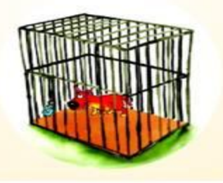
Tangkap dan Observasi Anjing tersebut minimal 10 hari pasca gigitan.