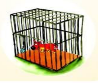
ခွေးကိုလှောင်ထား၍ အနဲဆုံး (၁၀-၁၄)ရက်စောင့်ဂြာည့်ပါ။